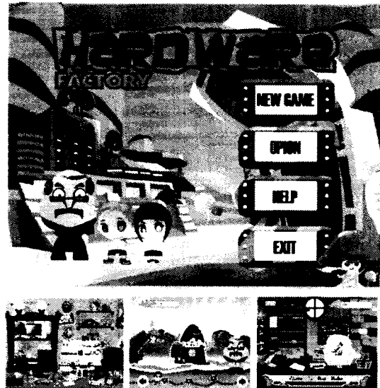
รูปที่ 2 เกมคอมพิวเตอร์เพื่อการสอนวิชาคอมพิวเตอร์ บูรณาการคณิตศาสตร์